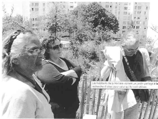
Les habitants de la Harlière visitent un jardin partagé à la recherche d'idées pour celui qu'ils vont utiliser.

Les habitants de la Harlière sont à la recherche d'idées pour mettre en oeuvre un jardin partagé. Ils ont visité celui du Clos-Toreau de l'agglomération nantaise situé au milieu d'immeubles. Le futur jardin partagé de la Harlière, de 900 mètres carrés, sera au milieu de l'espace vert en bout de la rue de Montargis.